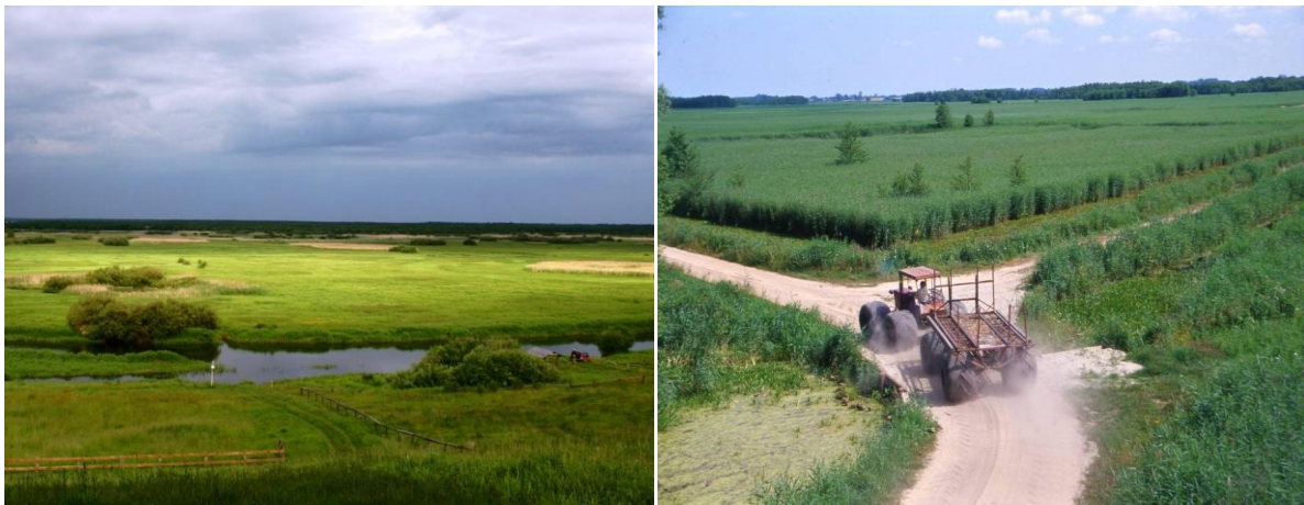
Abb. 1: Paludikulturflächen. Links: Genutzte nasse Moorwiesen an der Biebrza. Rechts: Schilfkultur für die Gewinnung von Dachreet (Fotos: C. Schröder; A. Schäfer).

Paludikultur (von lateinisch palus = Sumpf) ist die nasse Nutzung von Moorstandorten. Während die herkömmliche, entwässerungsbasierte Moornutzung zu Torfverlust und somit zur Zerstörung der Produktionsgrundlage führt, kann Paludikultur den Abbau des Torfkörpers verhindern, die hohen Treibhausgasemissionen und sonstigen Stoffausträge reduzieren und eine dauerhafte Nutzung ermöglichen (Abb.1).